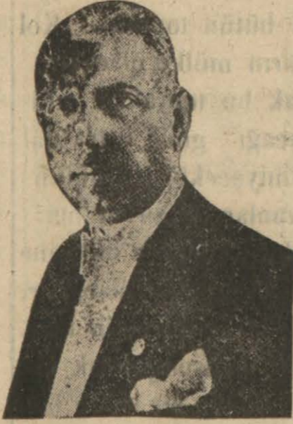
Tayyare Cemiyeti Umumi Başkanı Fuad

Bugü 57 Vilâyet ve 412 Kazada Şubesi, 120 Bin Üyesi Vardır.