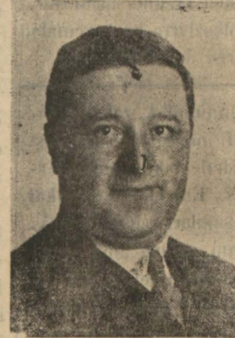
Ziraat Bakanı Muhlis

ziraat siyasamıza Da Büypk Ulus işleri arasında Geniş yer verilecek.